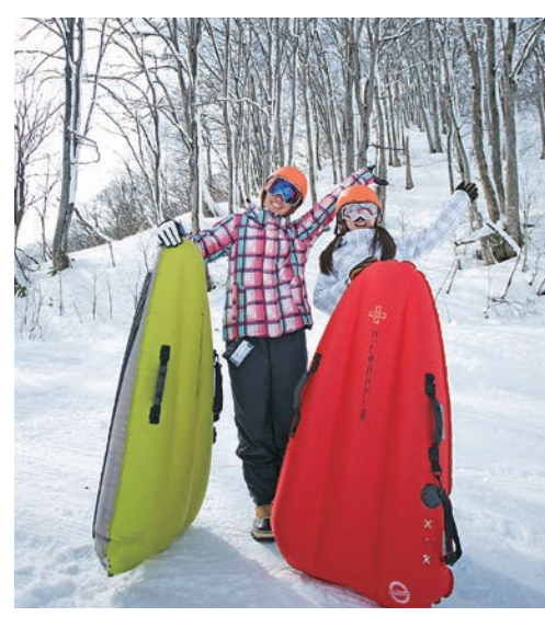
還有可一次體驗空氣船和雪板車的套裝行程 120分鐘 1,500日圓

趴在塑膠製的空氣船上,盡情徜徉雪地的新雪上運動。獨特的速度感和浮游感滿載刺激,而且 只要將空氣船放氣,就能輕鬆攜帶,因此以歐洲為中心,逐漸擁有廣大的人氣。