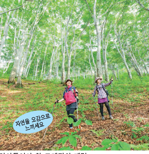
알아두어야 할 트레킹의 매력 걷는 것이 목적입니다. 경치와 함께 아름다운 꽃과 수령이 쌓인 대목, 들새와 야생 동물을 만나며 대자연을 느끼고 즐기실 수 있습니다.