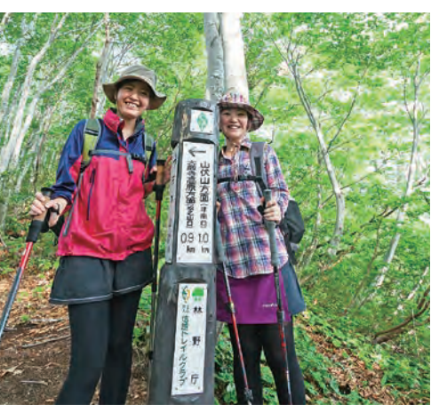
일본 굴지의 롱 트레일 '신에쓰 트레일'과 우에스기 겐신이 가스가산성에서 간토로 출정하기 위해 이용한 군도 '고도_마쓰노야마 가도' 도 추천 트레킹 코스입니다.

맑은 공기를 마시면서 산길을 걸으며 자연의 풍 요로움을 느끼는 트레킹, 산길이 익숙치 않다면 가이드가 포함된 투어로 안심하고 즐기세요. 비 진바야시 하이킹과 아테마산을 오르는 트레킹 등 취향에 맞는 다양한 코스가 있습니다.