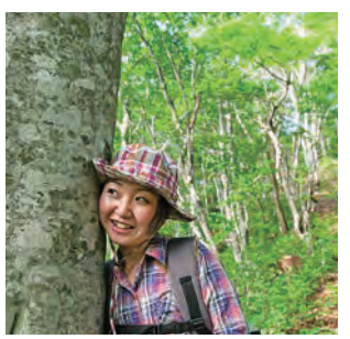
오감을 이용해 자연과 맞닿 으며 재충전하세요.