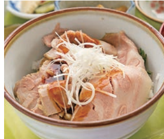
쓰마리 포크 (돼지 고기)